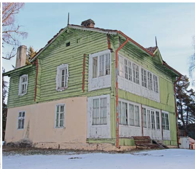
Старият лесничейски дом