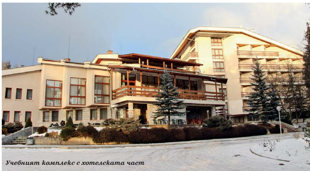
Учебният комплекс с хотелската част