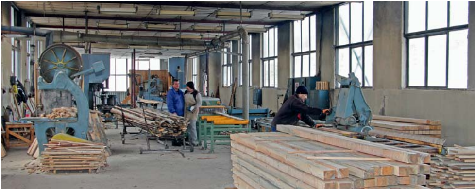
Учебно-производственият цех за дървопреработване