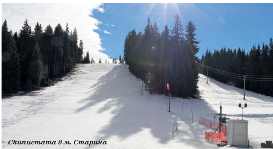
Скипистата в м. Старина